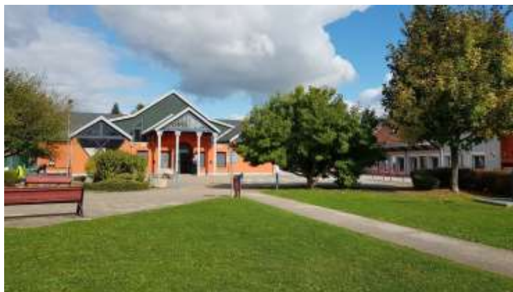
Maison pour Tous